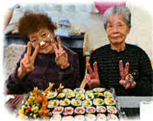
完成しました！！ たくさん食べるぞ！