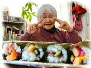
綺麗に巻けたでしょ～？ いただきます♡