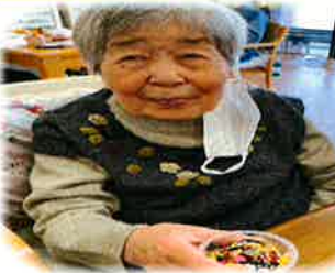
食べるのが勿体ない！ 仲良く作りました♪