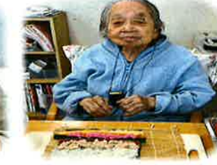
上手く巻けるかな？