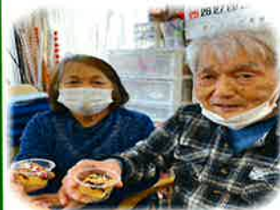
ハッピーバレンタイン！ 嬉しいなあ～