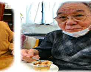
甘いものはいいね☆